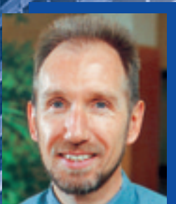
Der Autor: Josef Hund, Fiber Systems

Die Bevorratung umfasst das aktuelle Voith Paper Produktprogramm von Fiber Systems, aber auch die früheren Stoffaufbereitungsprodukte von Voith, Voith Sulzer, Sulzer Papertec, Sulzer-Escher Wyss, Bird und Morden, – ein Angebot an die Papierindustrie, ihre fabrikspezifische Bevorratung zu optimieren und Redundanzen zu minimieren. Dies unterstützt Voith Paper künftig durch eine Online-Lagerabfrage unter Verwendung der Internet-Funktionalität.