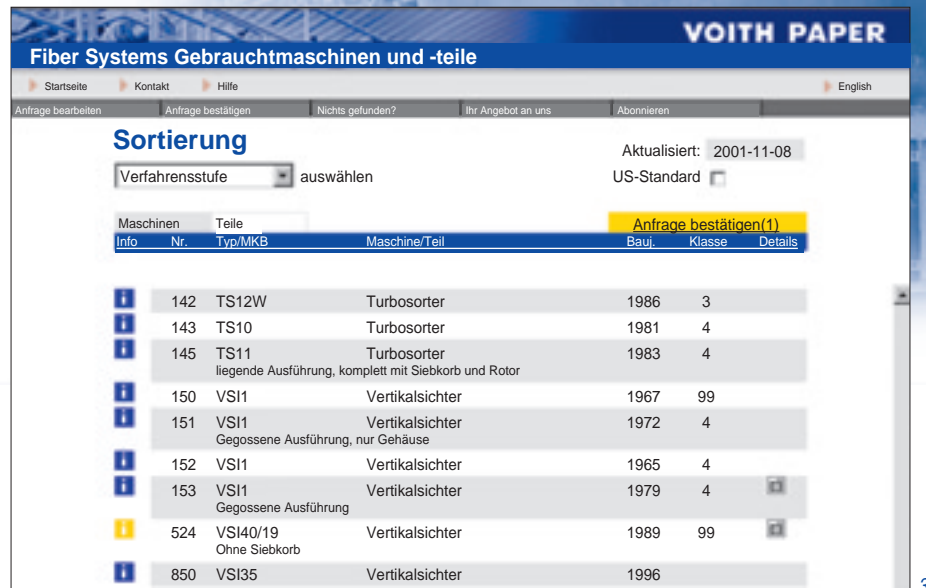
Abb. 3: Ausschnittergebnis für Gebrauchsmaschinen der Verfahrensstufe Sortierung.

Die gewählten Positionen werden mit „ Anfrage bestätigen “ an den zuständigen Sachbearbeiter bei Voith Paper Fiber Systems übermittelt, der Ihnen umgehend die gewünschten Informationen zusendet. Vor dem Absenden können Sie noch Hinweise und Wünsche im Bemerkungsfeld eintragen.