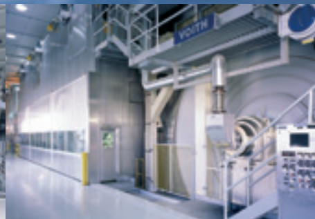
Paperikoneet kartongeille ja pakkauspapereille