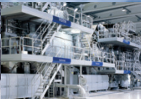
Paperikoneet graafisille papereille ja erikoispaperikoneet