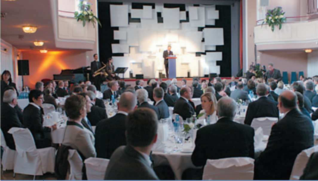
Kuva 1: Näkymä Heidenheimissa pidetystä juhlatilaisuudesta.