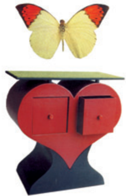
Kuva 3: "Heat-shaped Commode", 1997; 500 mm korkea lipasto, jossa on kaksi vetolaatikkaa, tehtynä lakatusta paperista ja pahvista.