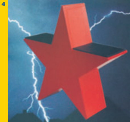
Kuva 4: "Red Star", 1997; 900 mm korkea ja 900 mm leveä tuoli paperista, pahvista ja nahasta.

ovat pienimuotoisia esityksiä "toisenlaisesta tavasta nähdä ja kokea". Voit ihailia ensisilmäyksestä värikylläisiä ja muodoiltaan aistikkaita pahvikasseja, joiden kantohihnoina ovat kiiltävästä langasta ketjuksi virkatut silmukat. Mutta, jos katsot tarkemmin, huomaat aistikkaan kassin pinnassa rahvaanomaisen ja sottaisen kinkkumakkaraa kuvaavan koristeen.