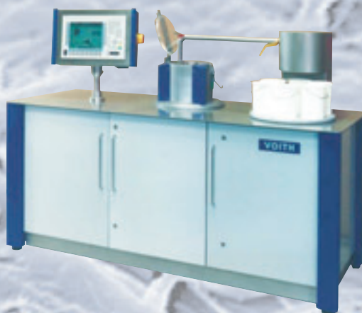
Uusi laboratoriojauhin laadunvalvontaan ja laboratoriokoeajoihin.