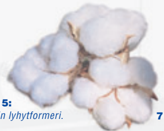
Kuva 4 ja 5: Voith Paperin lyhytformeri.

Jotkut näyttävät kuvittelevan, että setelit käyvät mihin tahansa – jopa tupakan sytyttämiseen. Me Voith Paperissa emme ole ainakaan vielä yltäneet sellaisiin teknologisiin saavutuksiin.