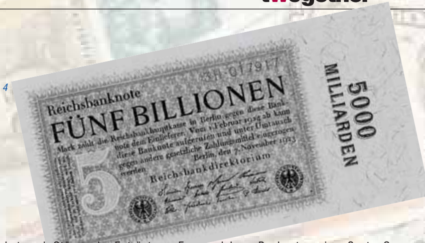
Abb. 4: Die Banknote mit dem höchsten Wert, die je gedruckt wurde.

zunächst noch Stürme der Entrüstung. Es wurde als „Teufelszeug“ und „Papierpest“ verbannt. Die papierenen „Zettel“ mit ihren Ziffern, ihren bildhaften Symbolen und zumeist falsch gedeuteten Beschriftungen wurden ähnlich den Spielkarten mit allerlei Hexerei, Aberglauben und dunklen Machenschaften in Verbindung gebracht. Letztere Assoziation hängt dem Wechsel so manchen Papiergeldbündels ja auch noch bis in die Gegenwart nach, was allerdings nicht dem Geld an sich anzulasten ist. „Non olet. (Geld) stinkt nicht“. Wie bereits Vespasian treffend feststellte.