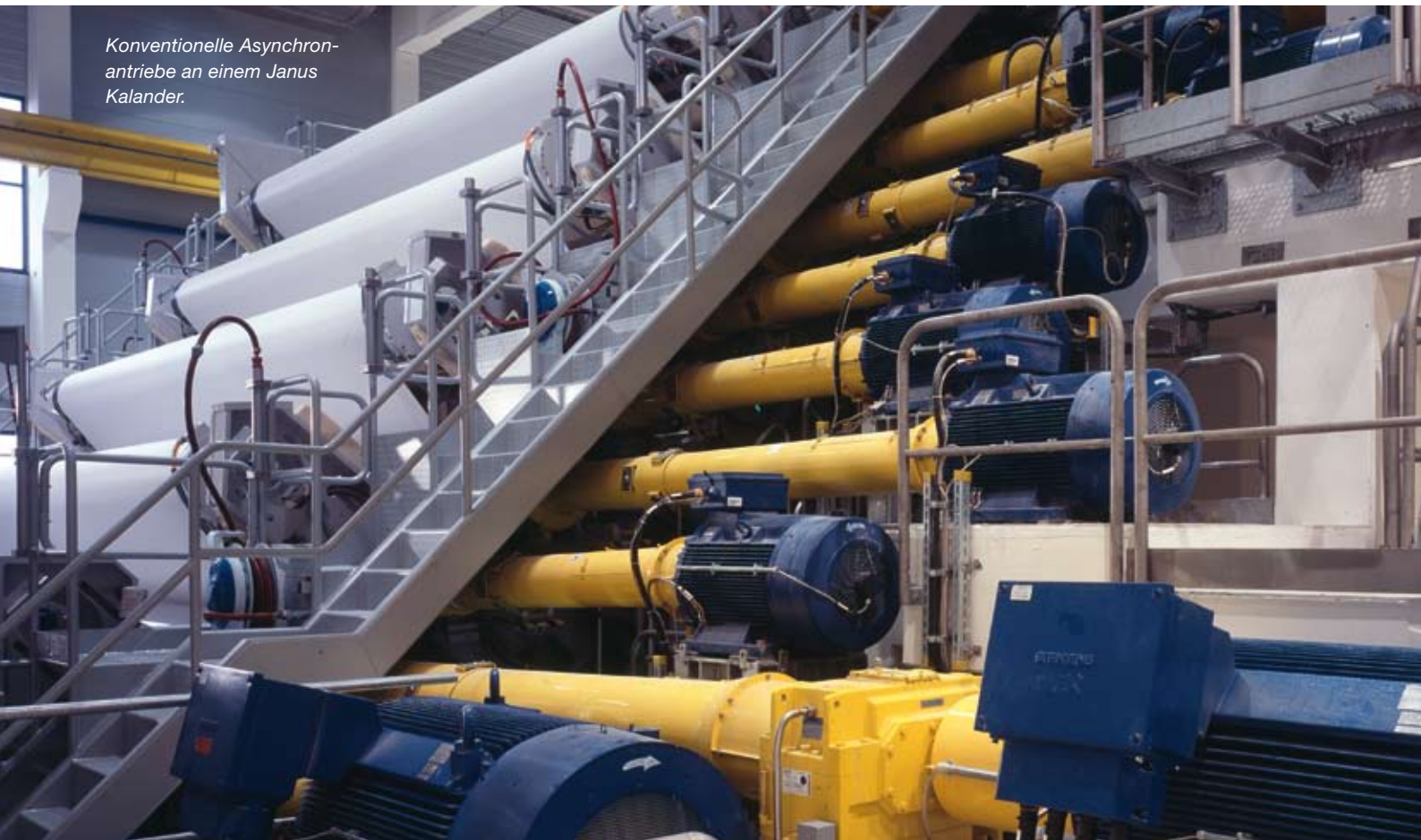
Konventionelle Asynchronantriebe an einem Janus Kalander.

Das Konzept punktet nicht nur mit einer besseren Wirtschaftlichkeit, sondern bietet auch technische Vorteile.