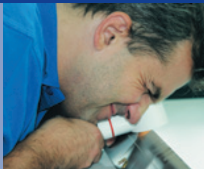
Voith Paper Rolls Service Mitarbeiter beim Schaberwechsel