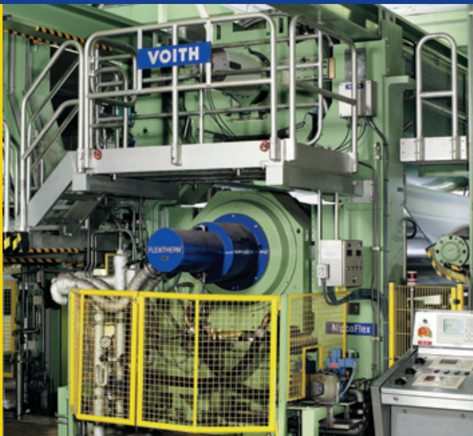
NipcoFlex-Kalander in Streichmaschine SM 1 bei Koehler Kehl