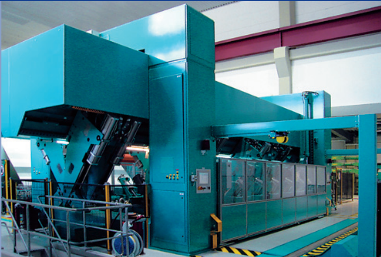
VariTop-leikkuri UPM:n Schongaun tehtaalla (patentoitu)