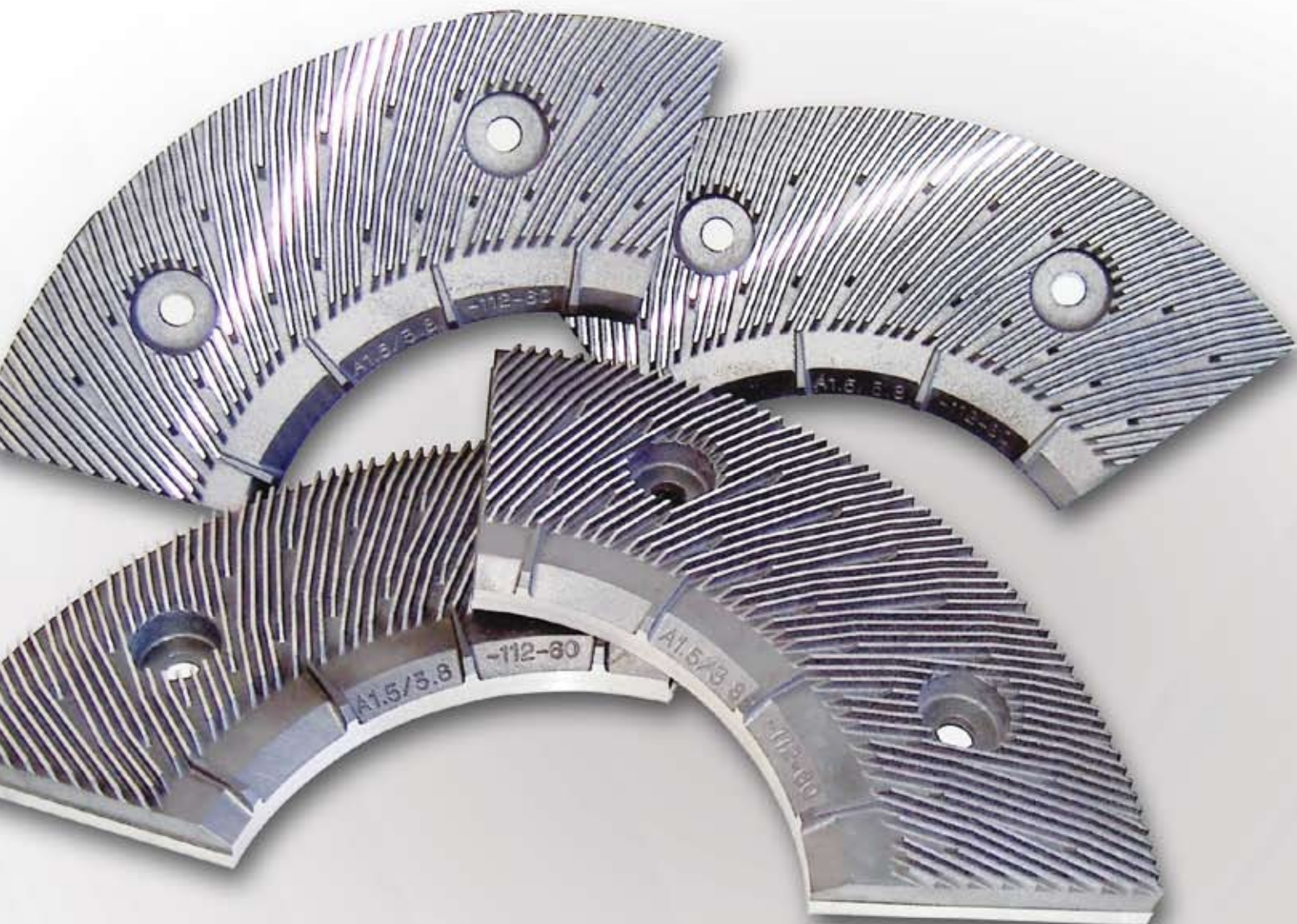
Abb. 1: Die Garniturenfamilie von PLURALIS reduziert die spezifische Kantenbelastung deutlich.

Energie sparen mit neuen Refinern und Refinergarnituren