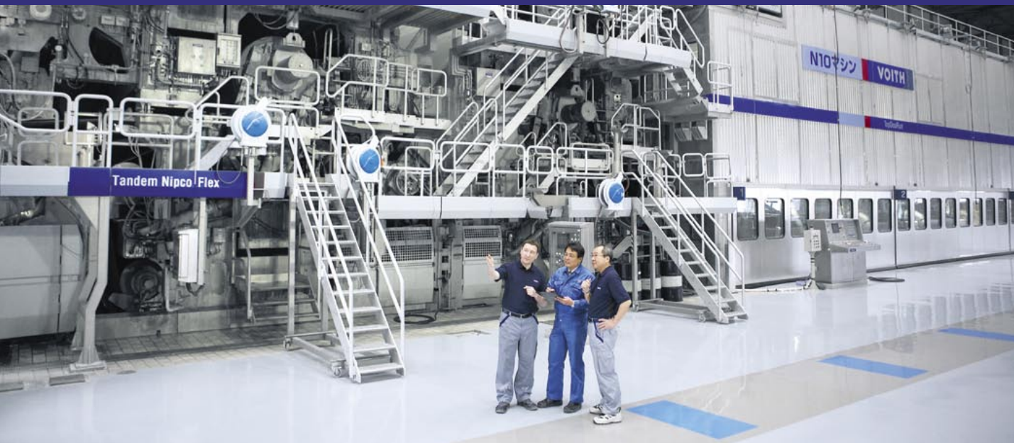
Новая производственная линия на предприятии Daio Paper в Японии.

БДМ-10 «Мисима» компании Daio Paper (Япония)