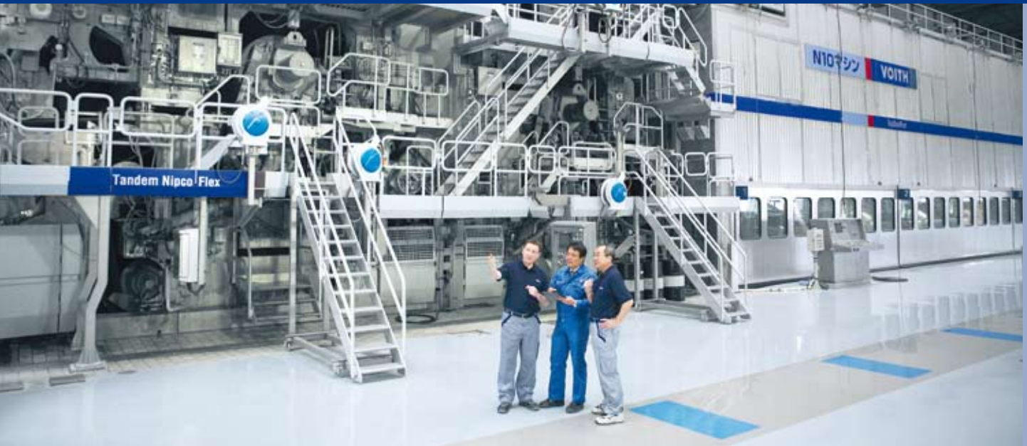
Daio Paperin uusi tuotantolinja Japanissa.

Mishima PM-N10-toimitus Daio Paperin tehtaalle Japaniin